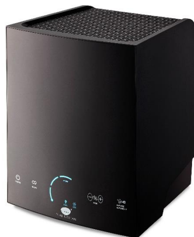
Pure & Clean