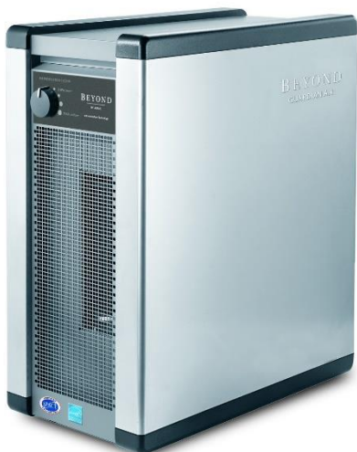
Beyond Guardian Air

ActivePure® is een gepatenteerde omgevingstechnologie waarmee veel alledaagse problemen met de luchtkwaliteit en oppervlakteverontreiniging binnen kunnen worden opgelost. Traditionele passieve technologieën, zoals HEPA, UV-C of Ionisatie, verwijderen schadelijke stoffen alleen op het moment dat die door de luchtreiniger stromen. De ActivePure® Apparaten doden als enige actief 24/7 virussen, bacteriën en schimmels op aerosol niveau in de lucht en op oppervlakken.